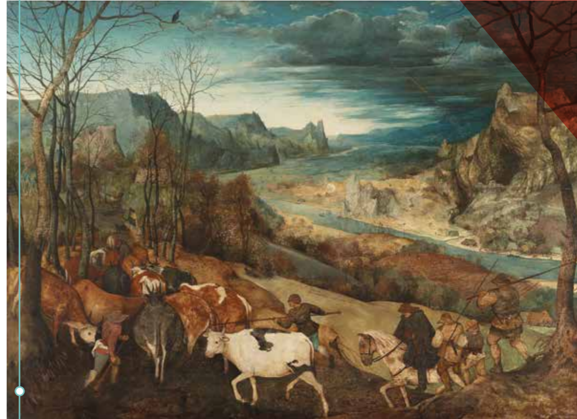
De terugkeer van de kudde

en nog veel meer! Check alle info op www.bruegel2019.be