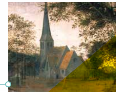
De kerk van Sint-Anna-Pede, te zien op 'De parabel van de blinden'

Concepttekening Stefan Devoldere, curator