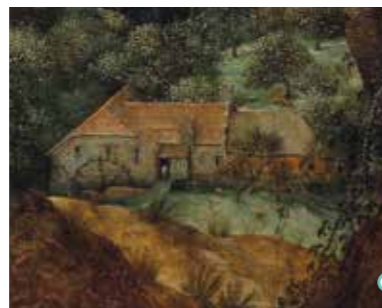
De watermolen van Pede, te zien op 'De ekster op de galg'.