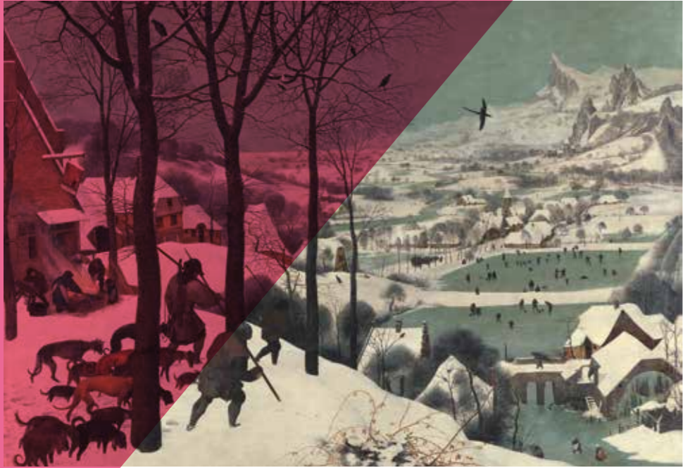
Jagers in de sneeuw © Wenen, Kunsthistorisches Museum