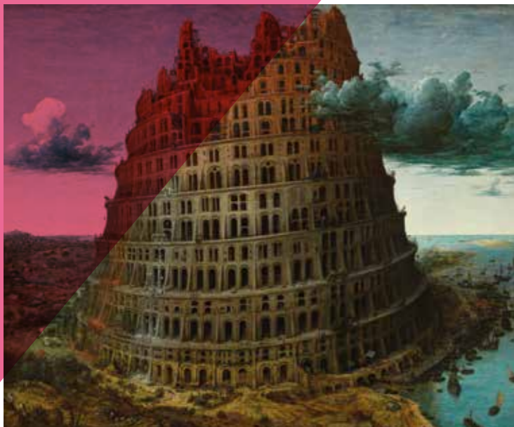
De toren van Babel © Rotterdam Museum Boijmans Van Beuningen