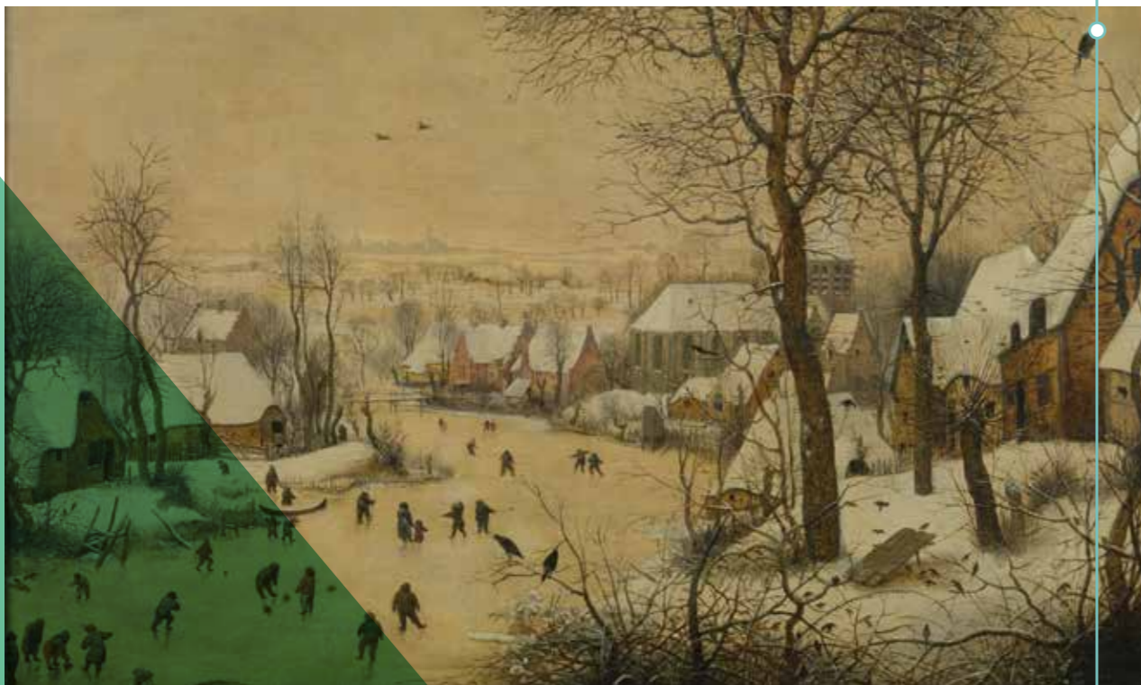
De Vogelknip © Brussel, Koninklijke Musea voor Schone Kunsten van België