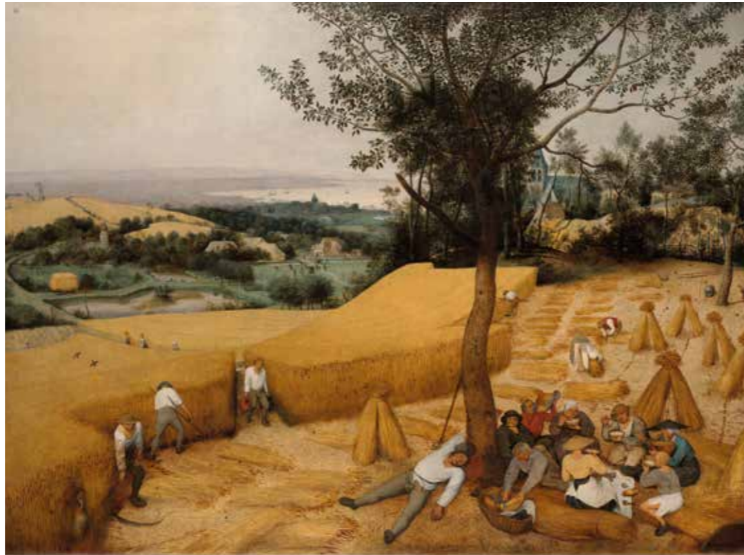
De oogst

Pieter Bruegel de Oude blijft een raadselachtig figuur. In feite weten we weinig van zijn leven. Bruegel werd geboren tussen 1525 en 1530. Waar precies is niet bekend, Bruegel bij Breda of Grote Brogel bij Peer?