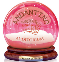
Andantinokoor Auditorium Optreden om 17 uur