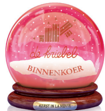
Lagere school De Kriebel Binnenkoer Knutselwerkjes leerlingen