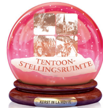
Bagaya Kapelle Tentoonstellingsruimte Wereldwinkelproducten, handwerk, stoffen, boodschappentassen