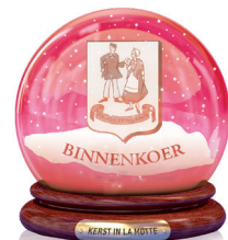
Volksdansgroep Pajottenland Binnenkoer Pensen, warme wijn, advocaat, confituur, limoncello, vlaai