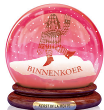
Toneelkring Harlekijn Binnenkoer Hasseltse koffie, advocaat