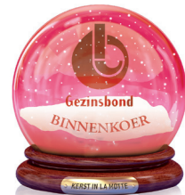
Gezinsbond Binnenkoer Jenever, snoepbrochetten