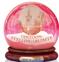
Parochieploeg Sint-Ulrik Tentoonstellingsruimte Kerst- en bijbelboeken + fotoshow