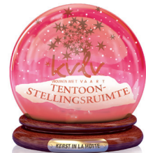
K.V.L.V. Tentoonstellingsruimte Kerstkaarten, KVLV-boeken