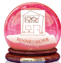
Vriendenkring Klein Klein Kleuterke Binnenkoer Hot-dogs & pannenkoeken, kleuter-viskraam