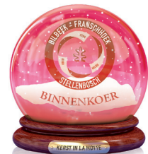
Projecten Franschoek Binnenkoer Zuid-Afrikaanse wijn