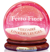
Ferro Fiore Vestiaire linkervleugel Mattetaarten, zelfge- maakte armbandjes van fietsbanden