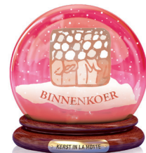
Oudercomité De Kriebel Binnenkoer Warme wafels