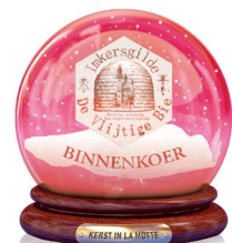
De Vlijtige Bie Binnenkoer Honing, stuifmeel