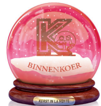
Kleuterschool Klein Klein Kleuterke Binnenkoer Glittertattoos, knutsel- werkjes, kerstballetjes