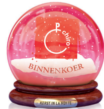
Chiro Kapelle Binnenkoer Ajuinsoep, chocomelk, cuberdons, truffels, kokos- koekjes